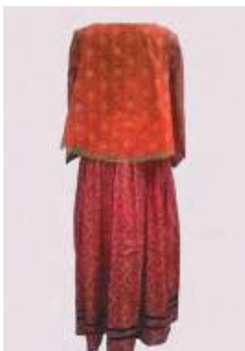
Праздничная «парочка». Из хлопчатобумажной ткани, верхний элемент (кофта) с хлопчатобумажным подкладом, отделкой машинным кружевом, сутажем, фигурной строчкой. Из фондов ОГИК музея