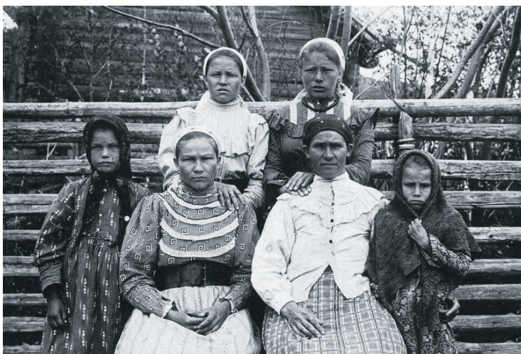
Казачки. Из альбома Н.Г. Катанаева «Типы казаков. Сибирские казаки на службе и дома», 1909 г. Из фондов ОГИК музея