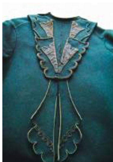
Детали декора спинки верхней одежды казачки, уроженки д. Ямино Такмыкского поселения Большереченского р-на Омской обл. Из шерстяной и шелковой ткани, шнура. Из фондов Омского государственного историко-культурного музея-заповедника «Старина Сибирская»