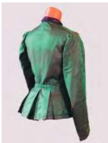
Праздничная «парочка» (элемент). Из шелковой тафты с хлопчатобумажным подкладом. Из фондов Марьяновского районного краеведческого историко-художественного музея Омской обл.