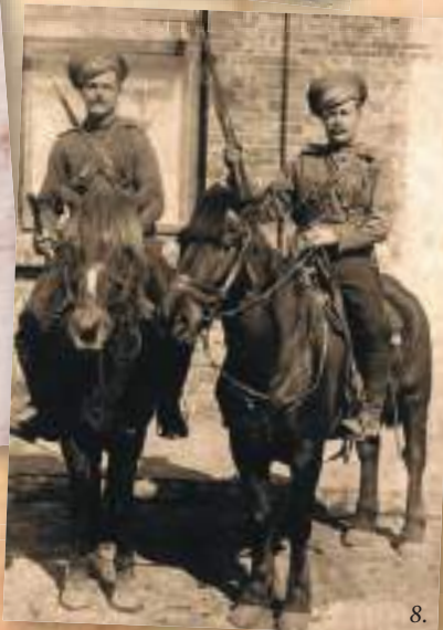
1. На службе.