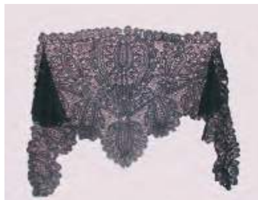
Женский головной убор – «файшонка». Из шелковых нитей, коклюшечное кружево. Из частной коллекции с. Волчанка Москаленского р-на Омской обл.