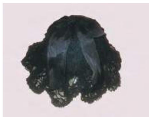
Женский головной убор – «накол»». Из кружева, ленты, хлопчатобумажной ткани. Из фондов ОГИК музея