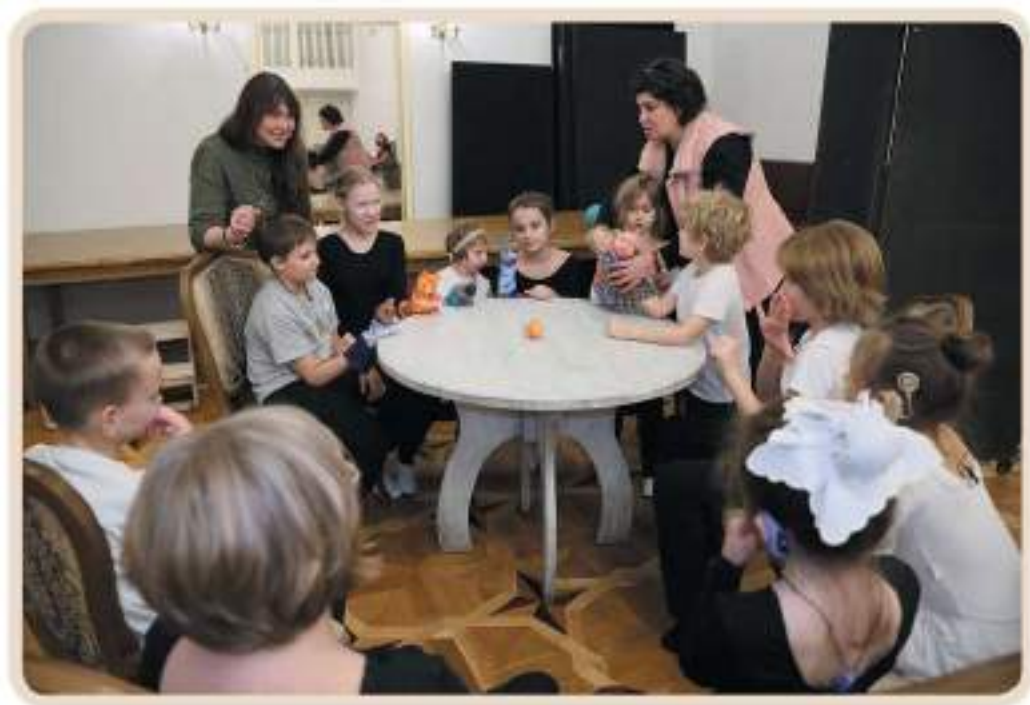
Театр «Ба-ба-бо». Сказка «Колобок»