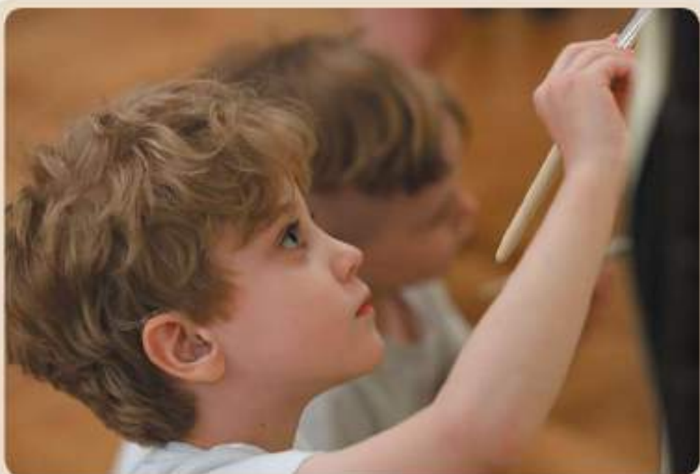
Открытый урок «Айболит» К.И. Чуковского