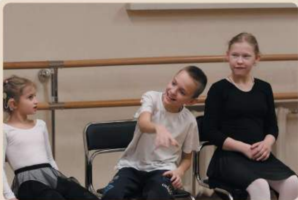
Упражнения для развития голоса