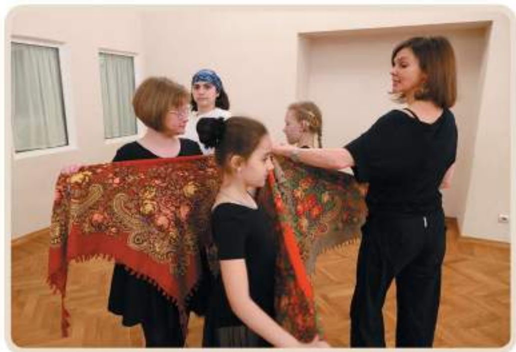
Русский народный танец