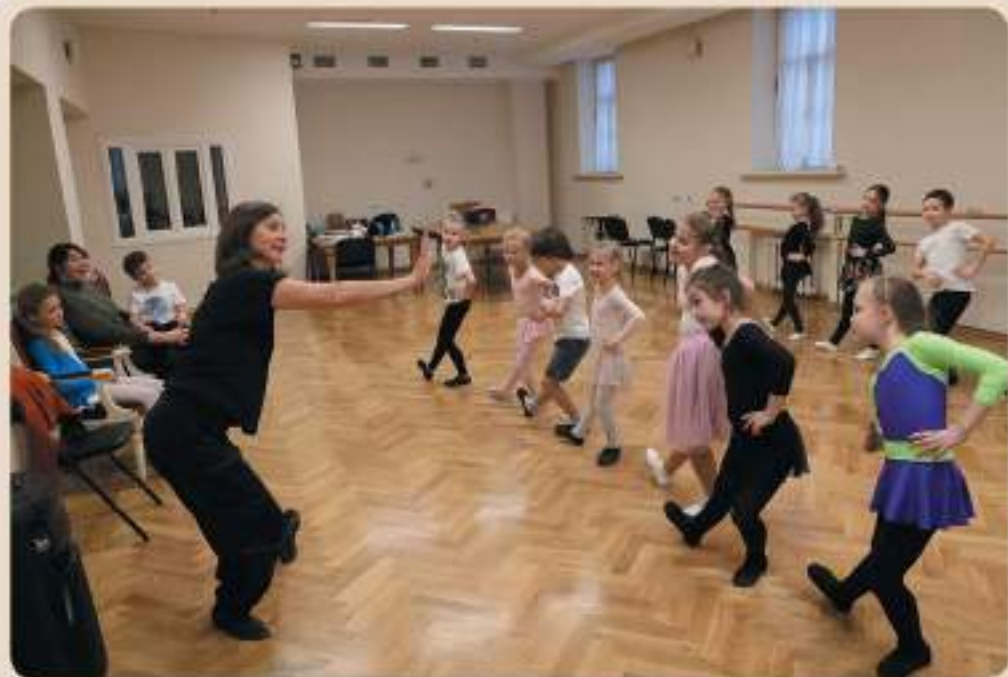
Урок народного танца