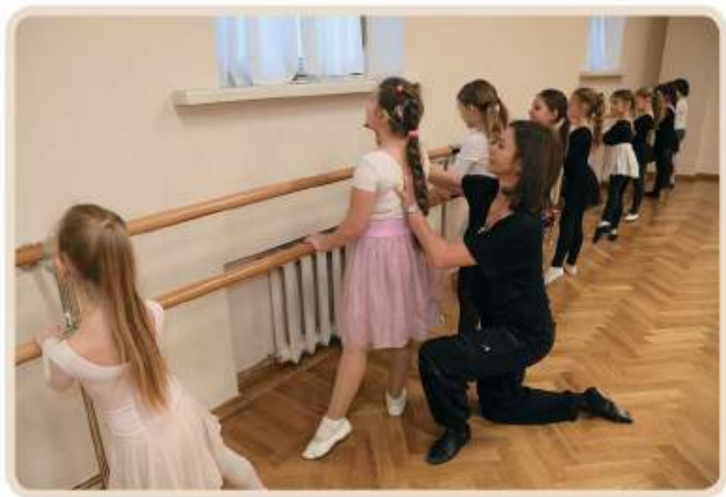
Урок классической хореографии