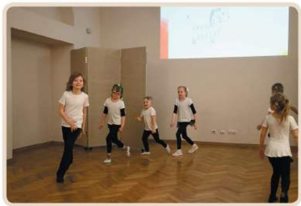
Открытый урок «Джунгли зовут»