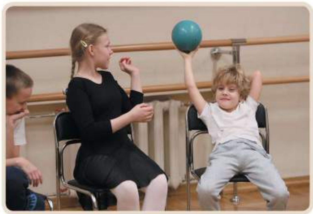
Упражнение «Передай волшебный мяч»