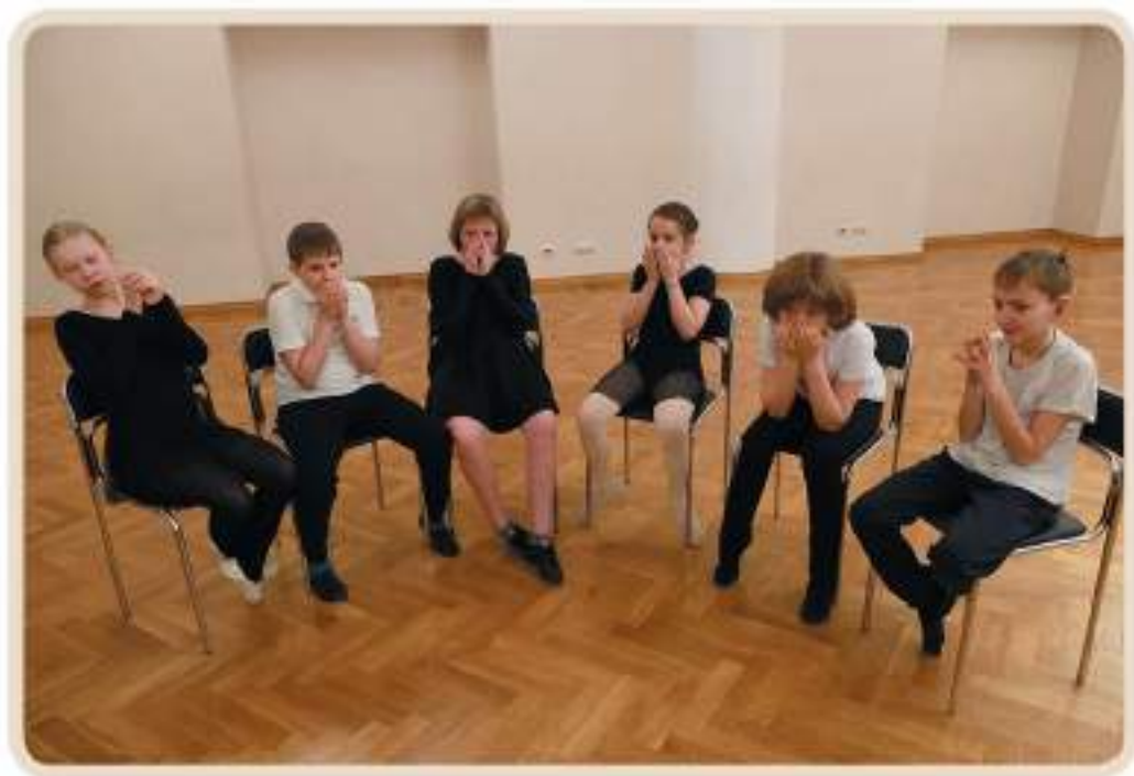
Упражнения для развития речевого дыхания