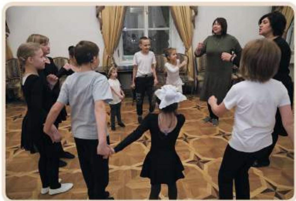
Упражнение «Броуновское движение»