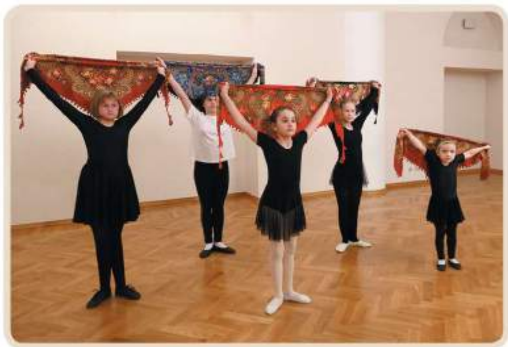
Русский народный танец