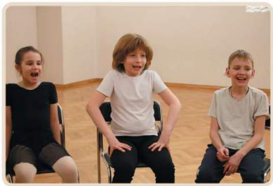
Упражнения для развития речевого дыхания