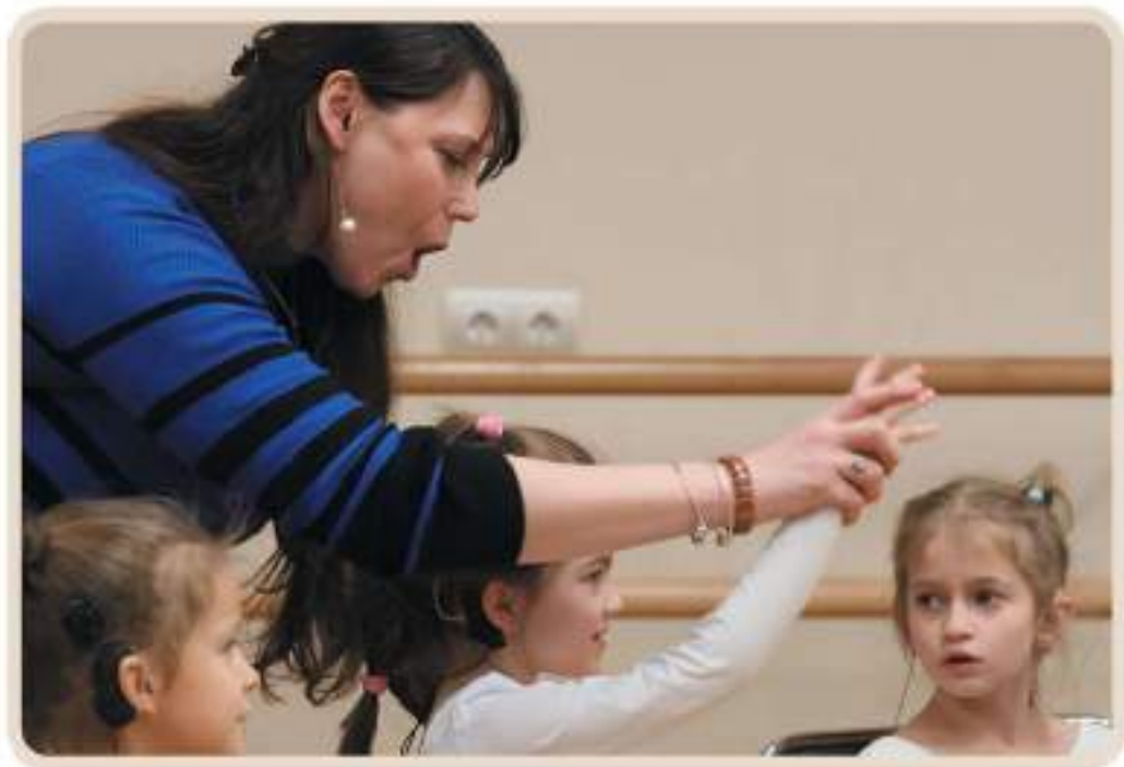
Упражнения для развития голоса