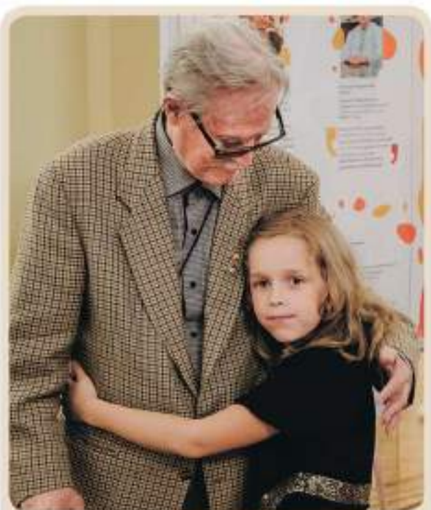
Народный артист СССР Ю.М. Соломин с воспитанницей проекта «ЛогоТеатр» на открытии выставки фотографа Н.С. Перовой «Я слышу в театре»

Народный артист СССР Ю.М. Соломин, рассуждая о современной роли искусства и его потенциале в воспитании нового поколения, перефразируя цитату великого русского драматурга А.Н. Островского, говорил о том, что «...без культуры и искусства нет нации». Великая сила искусства оказывается неисчерпаемым ресурсом для реабилитационной сферы.