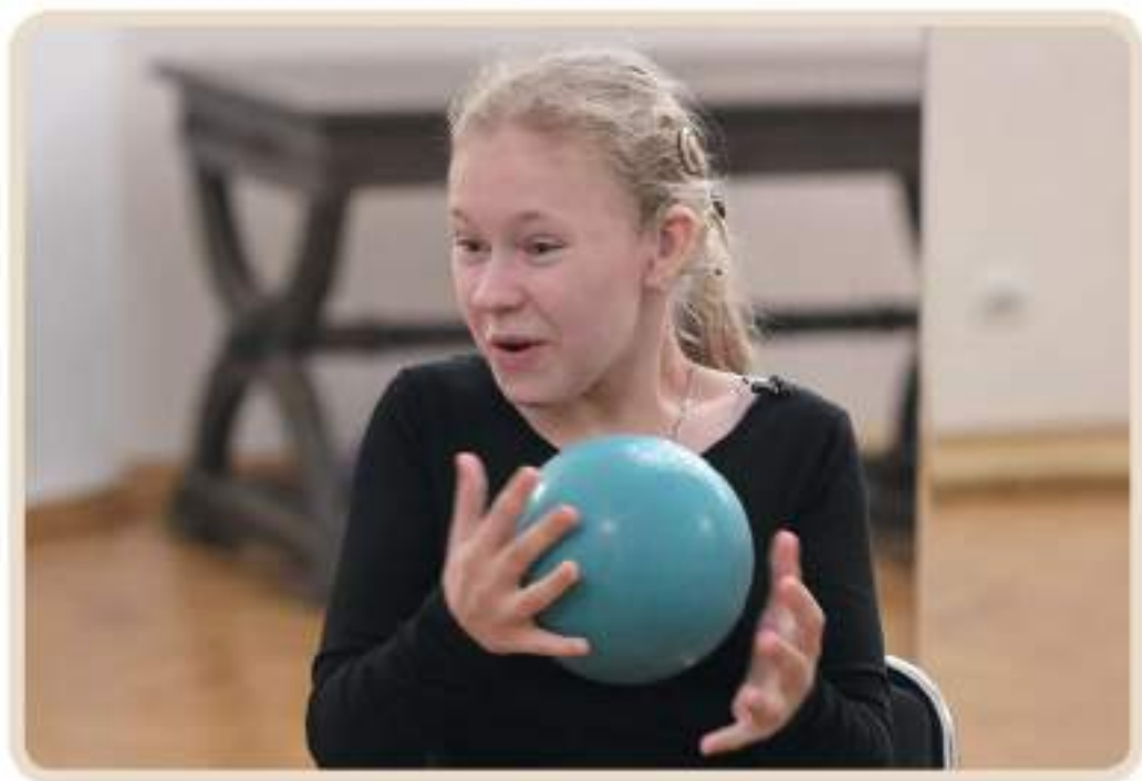
Игра для развития эмоциональной памяти