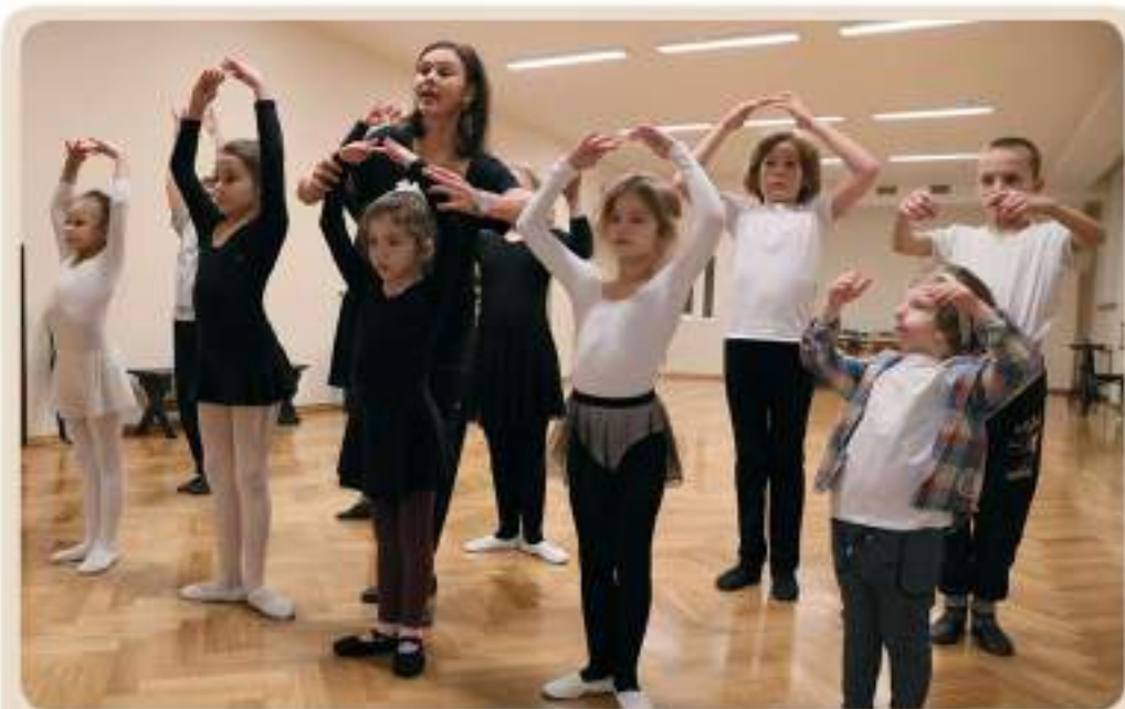
Урок классической хореографии