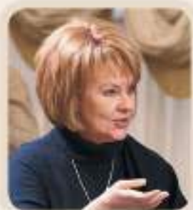
ТАМАРА АНАТОЛЬЕВНА МИХАЙЛОВА директор Государственного академического Малого театра России