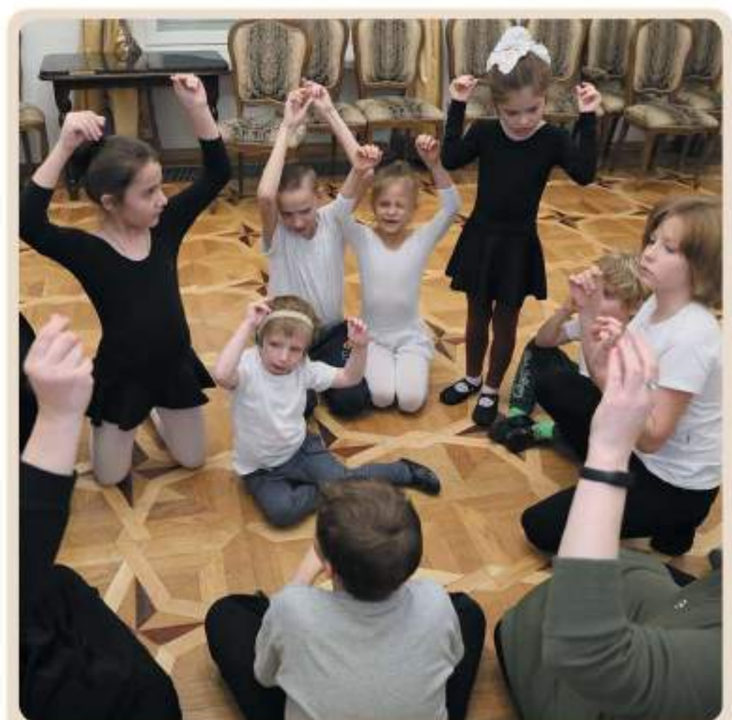
Ритмические упражнения для развития речи