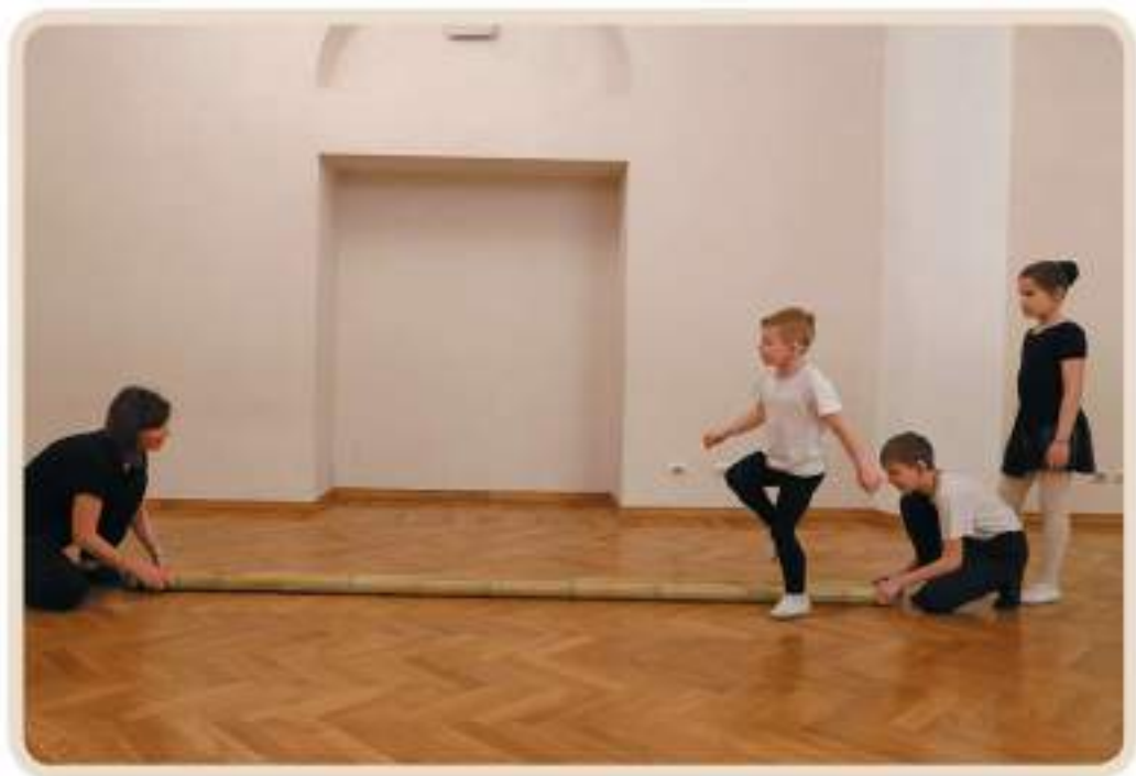
Вьетнамский танец с бамбуковыми палками