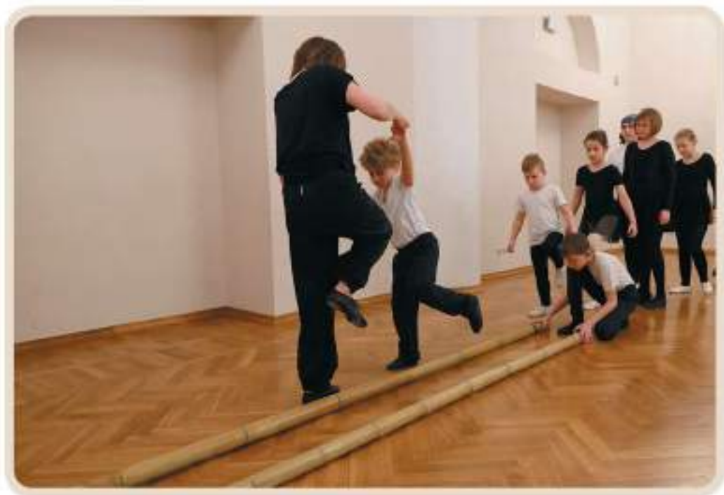
Вьетнамский танец с бамбуковыми палками