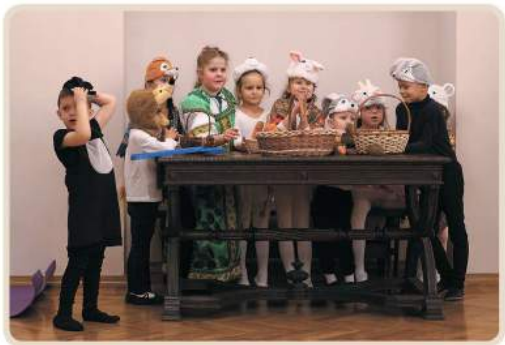
Воспитанницы «ЛогоТеатра» в спектакле «Мешок яблок» В. Сутеева