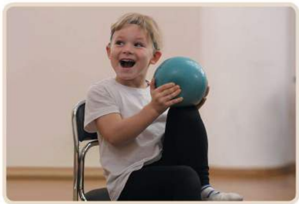
Игра для развития эмоциональной памяти