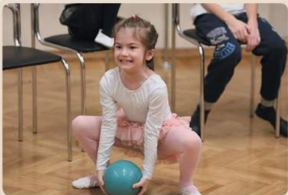
Упражнение «Передай волшебный мяч»