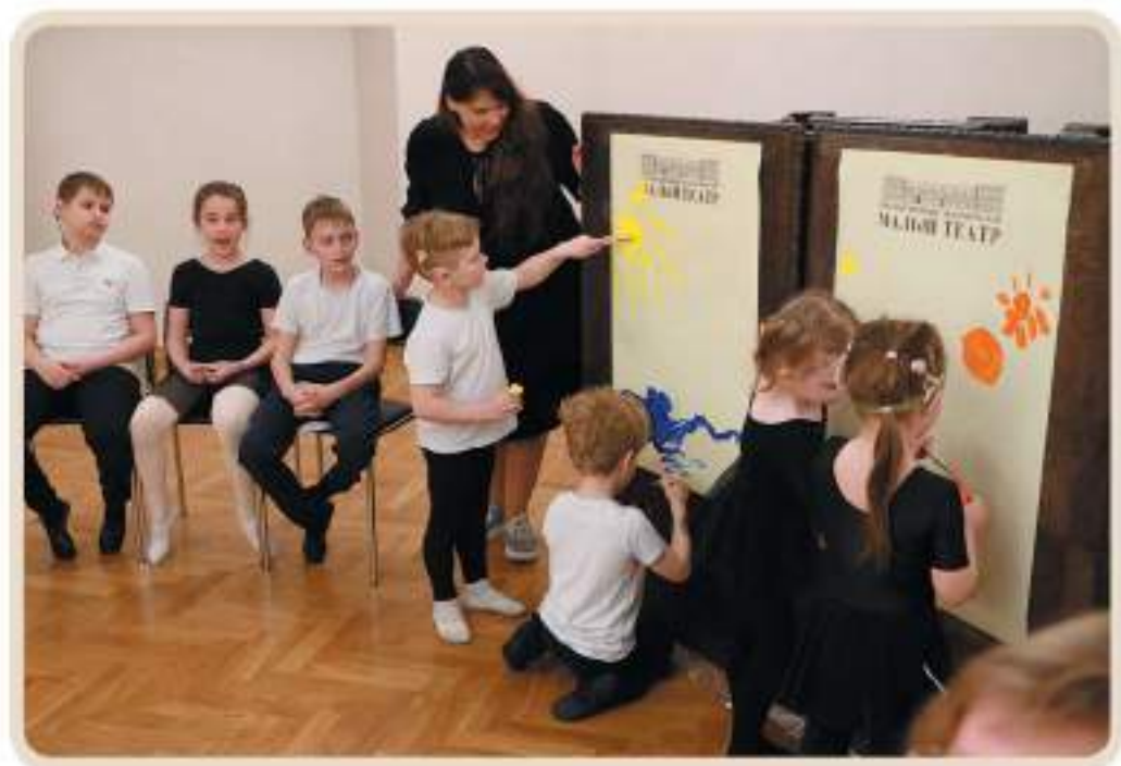
Открытый урок «Айболит» К.И. Чуковского