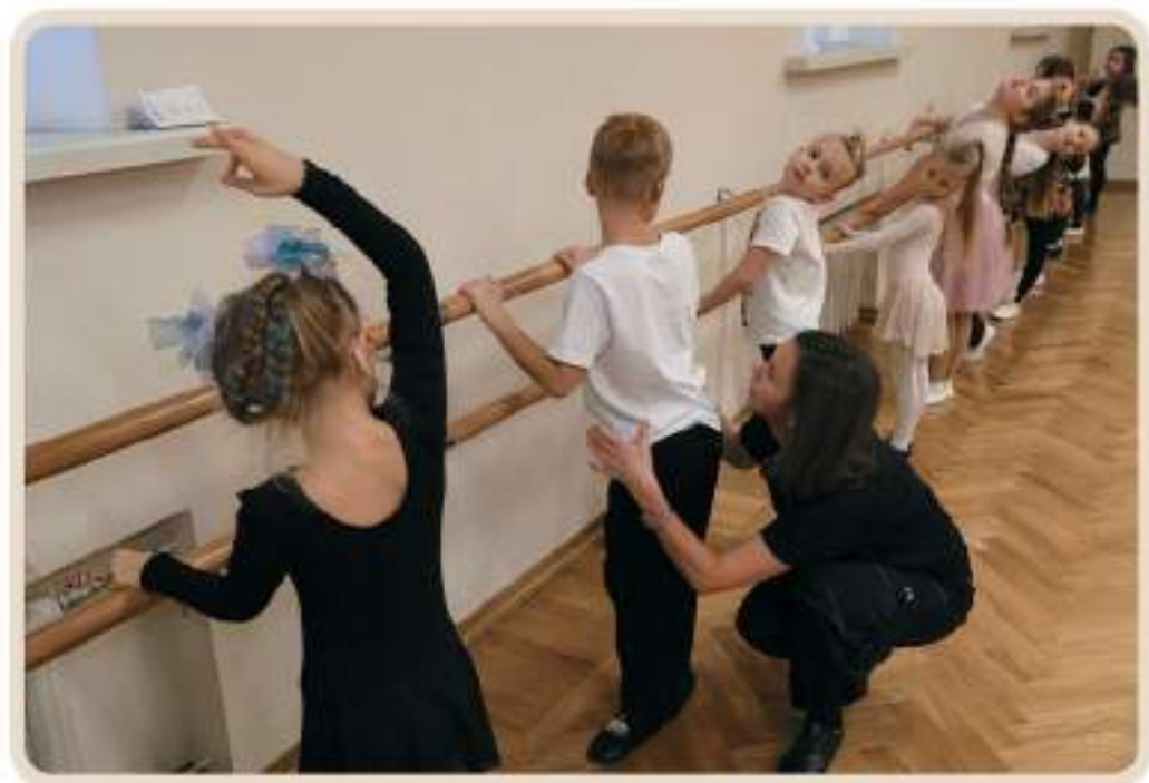
Урок классической хореографии