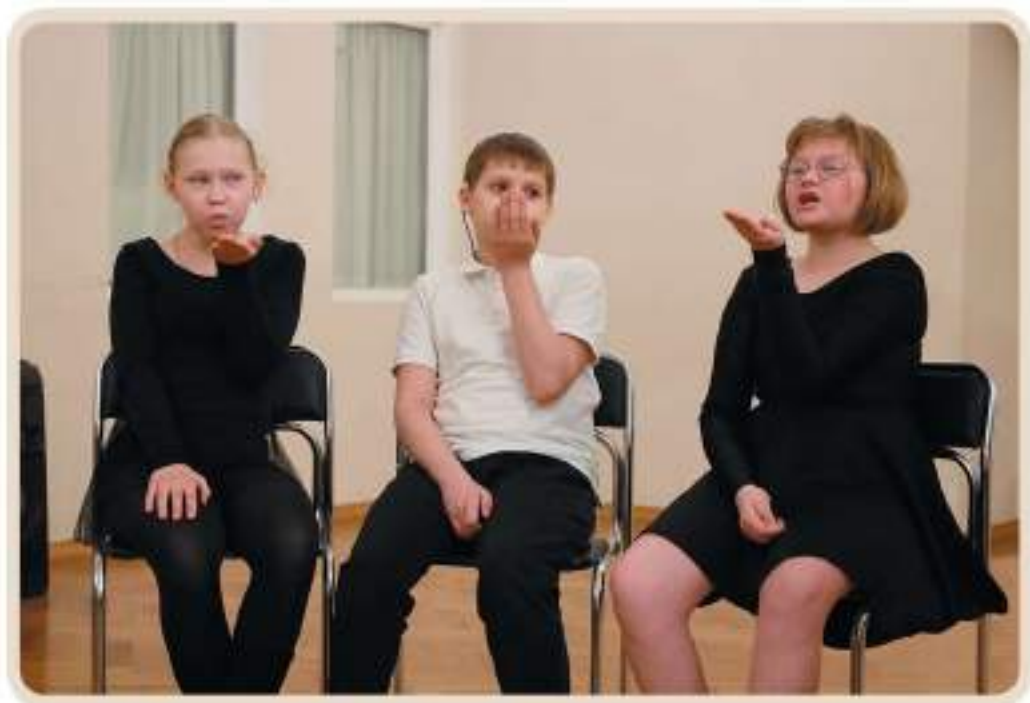
Упражнения для развития речевого дыхания