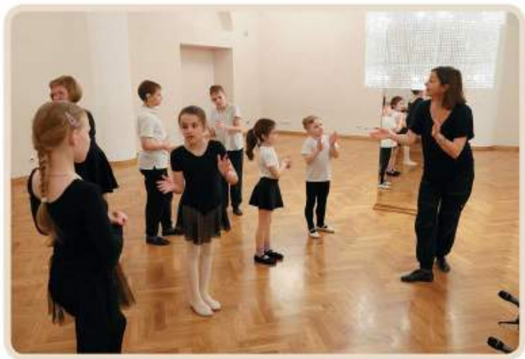
Урок классической хореографии