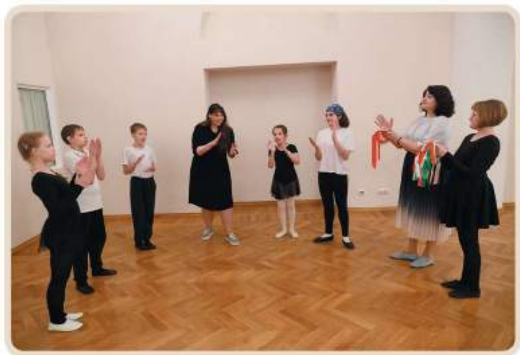
Упражнения для развития чувства ритма