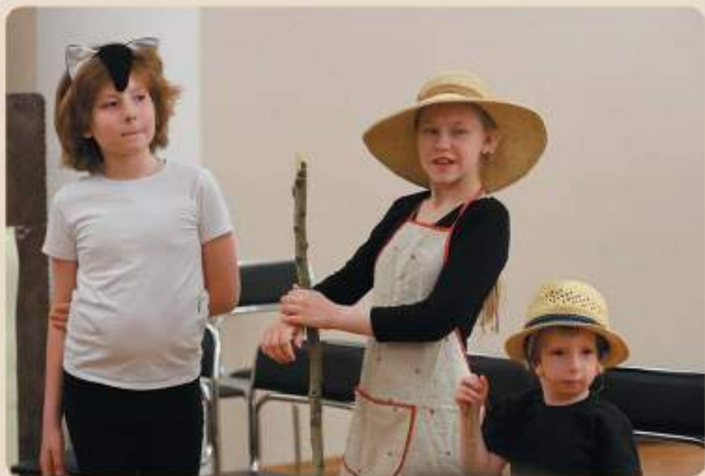
Открытый урок «Дом, который построил Джек» С.Я. Маршак